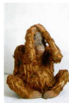
Irmela Maier Orang outang - 2007

« Former de futurs amateurs d'art, avertis et critiques, prompts à décrypter toutes les tentatives de supercherie »