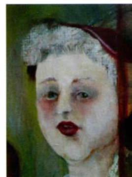
La Gente (détail)