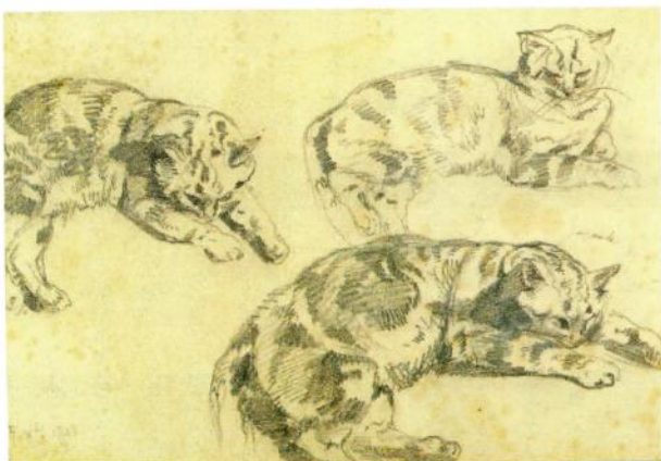
Eugène Delacroix - Trois études de chats - 1843

« L'activité artistique est donc « dédramatisée » et se retrouve ainsi réinstallée à sa juste place au cœur des préoccupations naturelles de l'homme. »