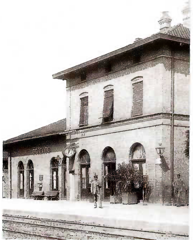
Photo : La gare de Dornach vers 1900. A l'époque, les briques façon DMC étaient encore apparentes

Parallèlement, le parvis de la gare sera réaménagé pour le début 2018 avec la création d'une zone de rencontre (circulation à 20km/h) et de parkings, le tout en privilégiant la présence de végétal et l'appropriation des riverains de la rue Antoine Herzog. L'ensemble devrait ainsi former une plaisante porte d'entrée du site DMC.