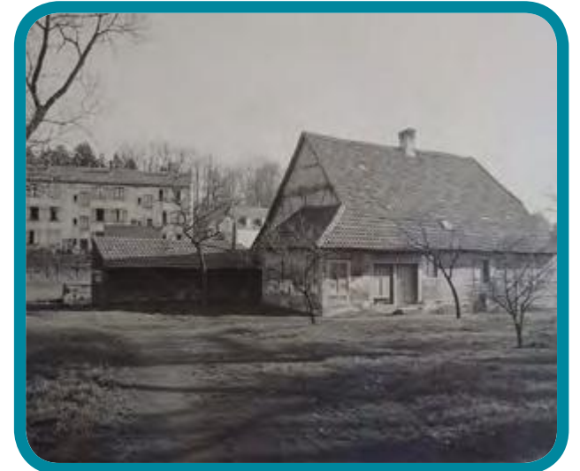
l'ancien foulon dans les années 1930, alors qu'il avait été transformé en habitation