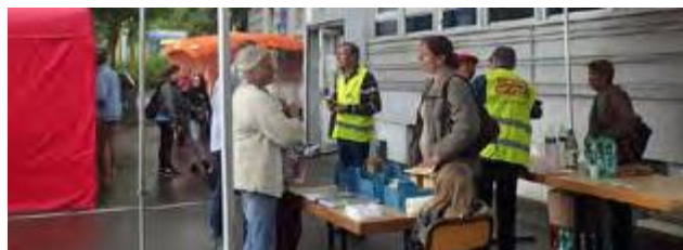
➤ Le 1er petit marché des Coteaux - le 16 mai 2018

Le marché des Coteaux, qui est en gestation depuis de nombreux mois, s'est tenu pour la première fois mercredi 16 mai pour un essai. Une demi-douzaine de commerçants traditionnels s'y sont investis.