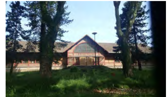
photo p.10 : Les berges de l'III vont bénéficier de plusieurs aménagements dans le cadre du budget participatif

photos p.11 : Dans un ou deux ans le Steinbaechlein devrait à nouveau couler à ciel ouvert dans la traversée de DMC