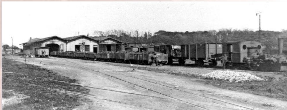
Le site du Schwartzacker

Un autre lieu de transbordement, connecté au rail et à la voie d'eau existe au dépôt-atelier du Schwartzacker , entre la gare de la Wanne et le canal du Rhône au Rhin, relié à la rue de Bâle par un pont mobile.