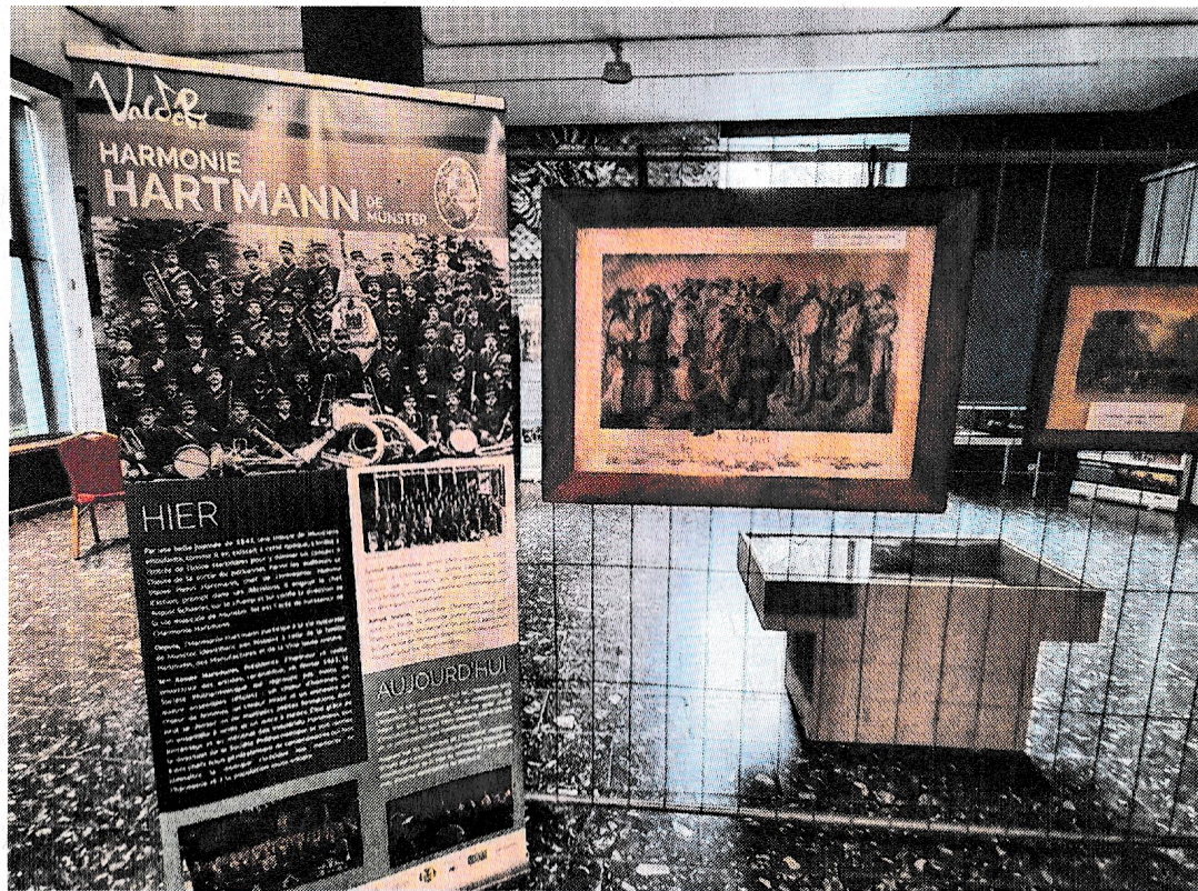
La salle Ratti du Mise accueille une exposition consacrée à l'histoire étonnante des Hartmann à travers notamment plusieurs panneaux.

« Magnats du textile », les Hartmann ont régné sur ce