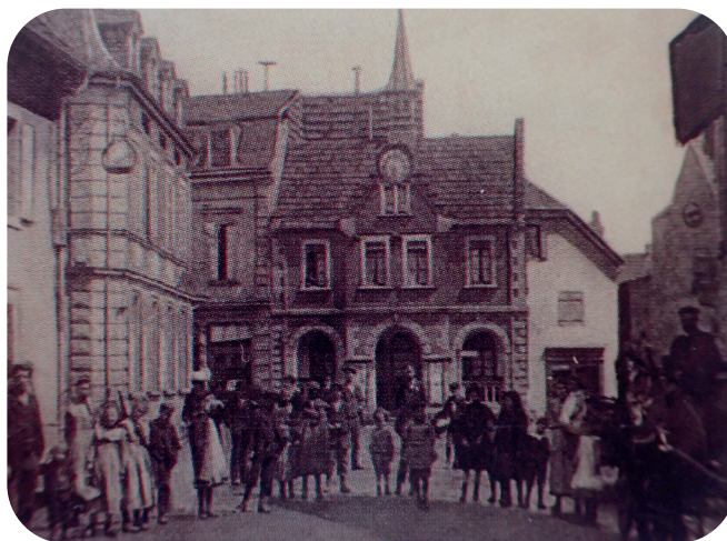
Ancien corps de garde, accolé à l'actuelle maison Lantz

- à gauche, à l'emplacement de l'actuel Crédit Mutuel, la cour du château Zu Rhein (Schlosshof). Dans ses locaux, les anciens communs du château, nombre d'anciens Dornachois ont passé dans leur jeunesse des retraites religieuses ou préparations à la communion solennelle. Les derniers bâtiments annexes du Schlosshof ont servi de dépôt au Carnaval de Mulhouse et viennent d'être démolis pour faire place à la résidence Arlekin en construction