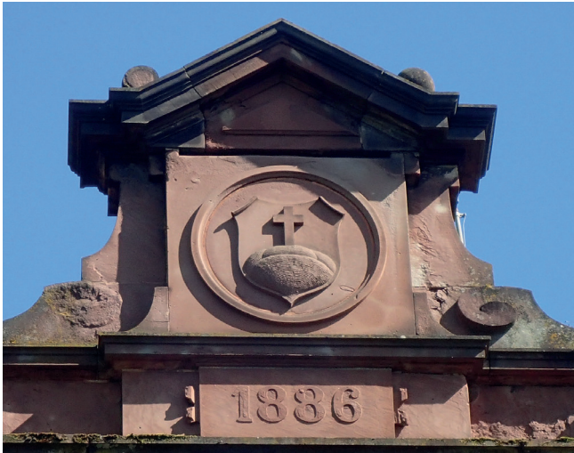
Armoiries de Dornach au fronton de l'école de garçons

L'église a été construite en 1900 à la place de l'ancien lieu de culte devenu trop petit (Dornach est passé de 500 habitants en 1800 à 7300 en 1900). A l'intérieur de l'église se trouve un tableau de la Sainte Trinité attribué au peintre tyrolien Pfanner, qui est inscrit à l'inventaire des monuments historiques depuis 1988. A l'extérieur, sur le pilier à droite de l'entrée, on peut admirer une intéressante méridienne, montre solaire de la fin du 19e siècle fabriquée par l'horloger colmarien Urbain Adam. Cette méridienne avait pour but d'indiquer avec précision l'heure de midi (solaire) pour régler l'horloge du clocher.