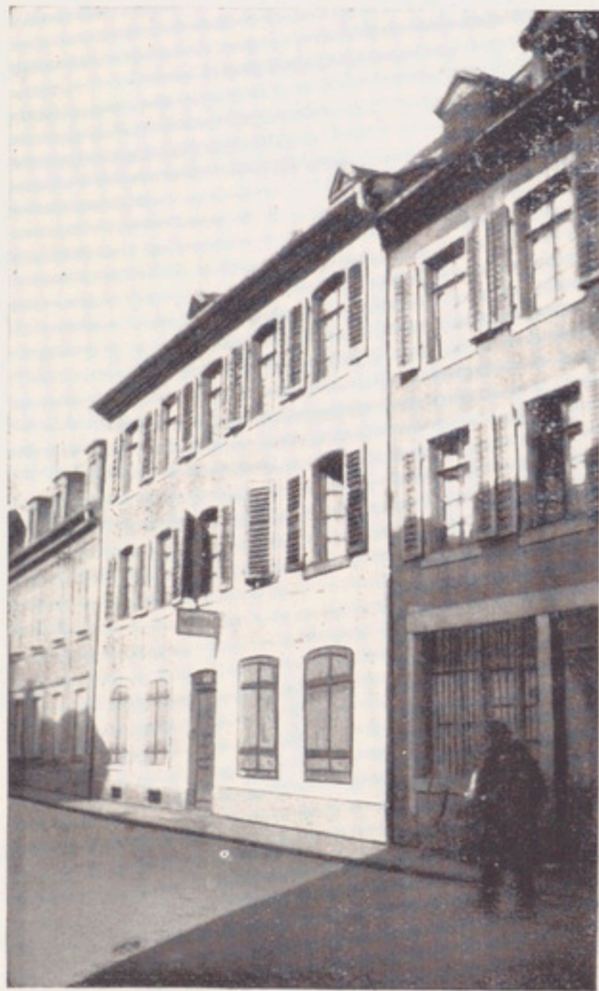
Maison Engelmann en 1776 - 8 rue Guillaume-Tell