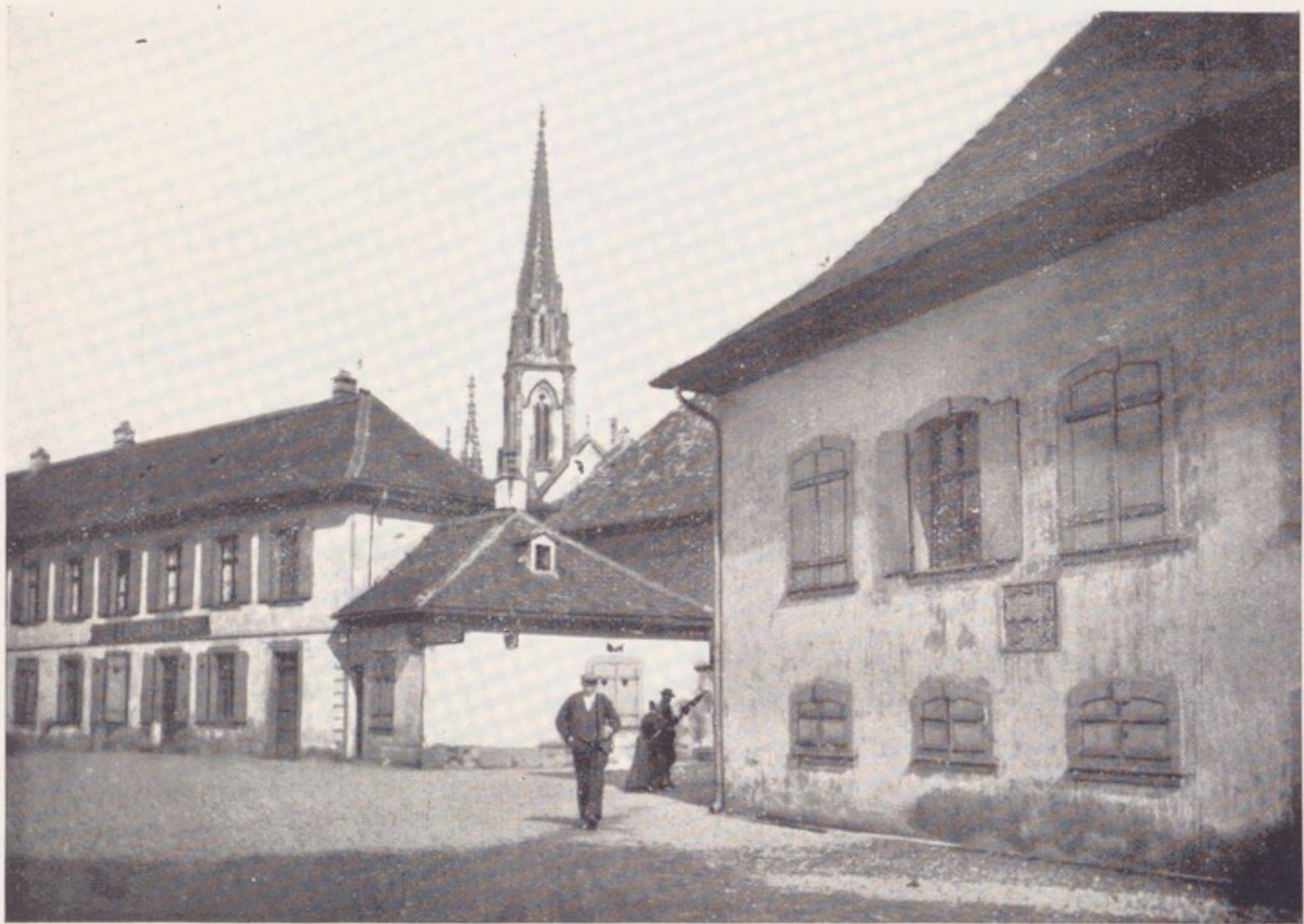
Intérieur de la cour teutonique en 1901