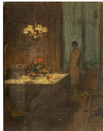
Marcel RIEDER L'Attente

illuminée soit par la lampe posée à la chaude lumière qui fait étinceler verres et carafes, soit par le lustre qui accentue le rouge des fleurs. Il semble que ce soit la même table, représentée sous un angle différent. Dans le tableau de droite, une silhouette féminine se détache de la fenêtre, donnant ainsi son titre à l'œuvre : la table est prête, on n'attend que les invités.