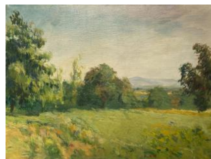
Charles FOLK Clairière

Cette clairière paisible, bordée d'arbres aux formes variées dont le feuillage permet au peintre de jouer de sa palette de verts, nous offre l'occasion de nous arrêter dans notre promenade pour regarder au loin la ligne bleue des Vosges et le ciel où les nuages sont à peine suggérés.