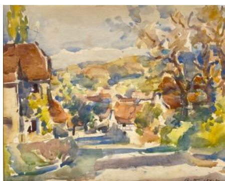
Charles FUETSCH Rue de village

Au premier regard, on a l'impression de voir un paysage ensoleillé, traité de façon presque abstraite par taches de couleurs. Puis on distingue les maisons cossues aux grands toits rouges, puis les arbres : d'abord le groupe de trois dont les ombres barrent la rue ensuite ceux, plus foncés, qui la bordent. Notre regard suit cette rue pour se perdre enfin dans les collines. Il émane de cette aquarelle une ambiance vivante et joyeuse.