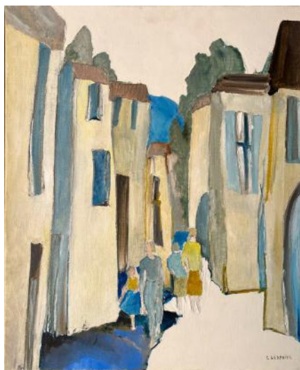
Evelyne WIDMAIER Ruelle

On ne trouve pas ce dessein chez Evelyne WIDMAIER : pas d'anecdote ; ces maisons sans rez-de-chaussée, ces ouvertures étroites et hautes mettent en valeur la flânerie des personnages et surtout donnent un mouvement ascendant, un élan vers le ciel sur lequel se détachent les feuillages des cyprès.