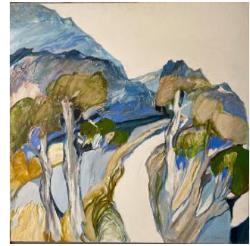
Evelyne WIDMAIER Le Chemin blanc

On retrouve la même dynamique et la même vigueur dans le tableau ci-contre aux camaïeux de bleus et de bruns. Notre regard est attiré par ce chemin blanc qui serpente entre les montagnes escarpées et les arbres élancés au feuillage malmené par le vent qui semble nous pousser à nous y engager.