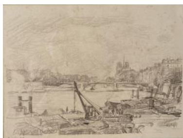
Alexandre URBAIN Seine, l'île de la Cité, 1914

La Seine et ses ponts sont le sujet d'une bonne dizaine d'œuvres de notre Collection. Alexandre URBAIN a vécu à Paris et ce dessin qu'il a réalisé avec beaucoup de précision date de 1914. Si les bâtiments n'ont guère changé, il n'en est pas de même pour les activités représentées au premier plan : il y a belle lurette que chargements, grues et portefaix ont déménagé.