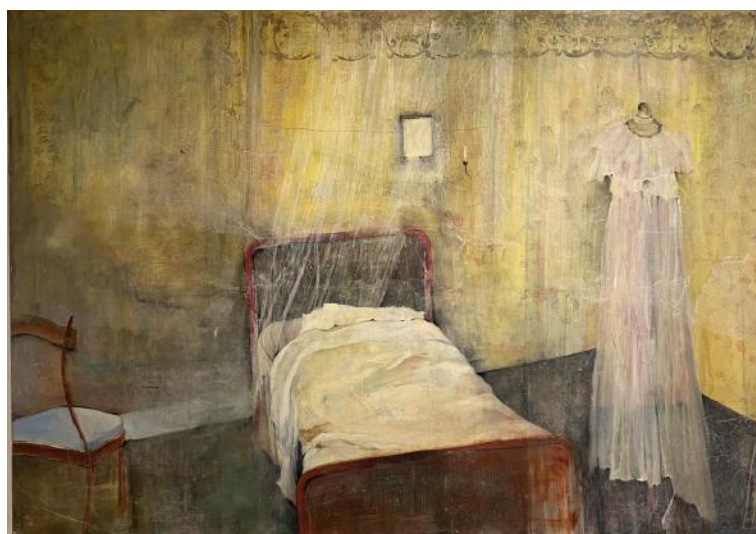
Dan STEFFAN La Chambre jaune, 2011

Pour l'instant, il n'y a pas de projet ni de calendrier précis mais dès qu'une exposition sera envisagée, vous en serez rapidement informés.