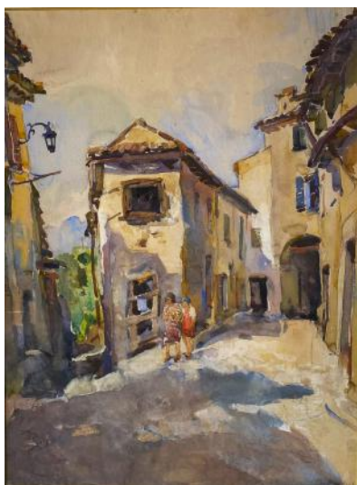
Charles FUETSCH Village provençal

Le hasard a réuni ces deux œuvres, au thème commun qui offre de nombreuses ressemblances : ruelles et maisons étroites, un porche à gauche, des volets bleus fermés pour se protéger de la chaleur, des personnages mère et fille les unes en rouge, les autres en bleu, une montagne à l'arrière-plan, au sol l'ombre, venue de la droite qui forme un contraste avec le sol lumineux. Pourtant ces deux œuvres, réalisées à des époques différentes, ne sont pas de la même inspiration. Charles FUETSCH donne une image réaliste de ce qu'il a observé ; il y a une abondance de détails : la lanterne à gauche qui attire le regard, les gouttières, les persiennes des volets.