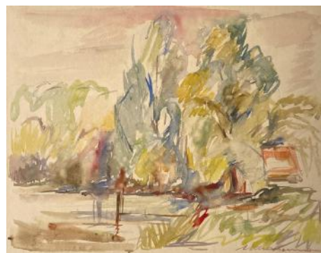
Arthur SCHACHENMANN Paysage sundgauvien

On voit, rapidement esquissés, à gauche un étang avec ce qui ressemble à un ponton, à droite le toit rouge d'une cabane, au fond des collines. L'artiste s'attarde sur la grande masse touffue des arbres, aux formes et aux couleurs variées, si importante qu'elle cache le ciel. En quelques traits, Arthur SCHACHENMANN évoque un paysage de ce Sundgau qui l'a si souvent inspiré.